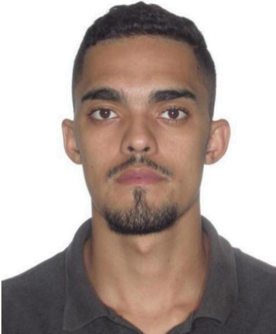
Foto da Habilitação